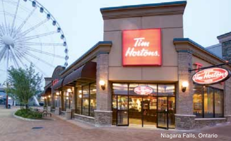
Niagara Falls, Ontario