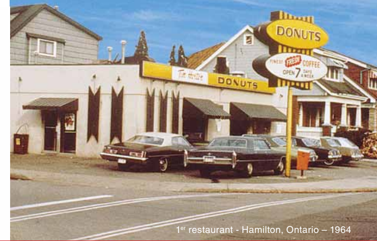
1 er restaurant - Hamilton, Ontario – 1964